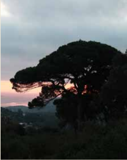
LA BAHÍA DE ALGECIRAS DESDE LOS TRES PINOS.

El molino de Escalona es el único molino que sigue en funcionamiento de los muchos que hubo en los márgenes de la Miel. Data del año 1758, aunque su maquinaria se modernizó en el siglo XX.