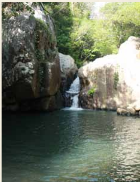
POZA DE LA CHORRERA, PARA DARSE UN BUEN BAÑO.