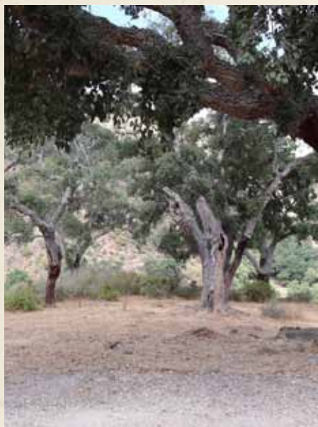
CHAPARRAL, DONDE DESAYUNAREMOS Y ALMOZAREMOS.

El lugar por donde transcurre en su parte alta y media conforma un bosque de galería, también conocido como "canuto",