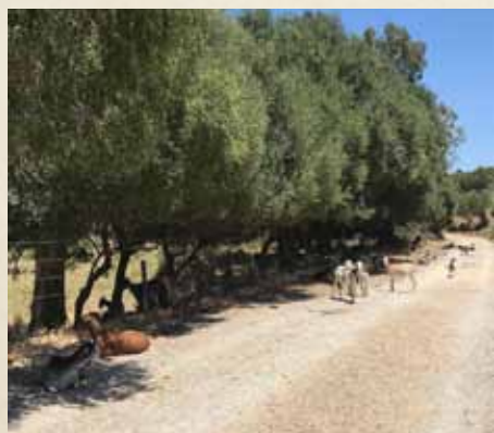
AL PRINCIPIO EL CAMINO ES ABIERTO Y ÁRIDO.

El lugar por donde transcurre en su parte alta y media conforma un bosque de galería, también conocido como "canuto",