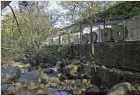
MOLINO DE ESCALONA.

El molino de Escalona es el único molino que sigue en funcionamiento de los muchos que hubo en los márgenes de la Miel. Data del año 1758, aunque su maquinaria se modernizó en el siglo XX.