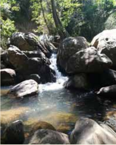
RÁPIDOS Y PEQUEÑA POZA DEL RÍO DE LA MIEL.

Se trata de un maravilloso rincón natural de Algeciras, donde su paseo romántico nos hará perder la noción del tiempo y apreciar la sencillez y belleza de nuestros paisajes.