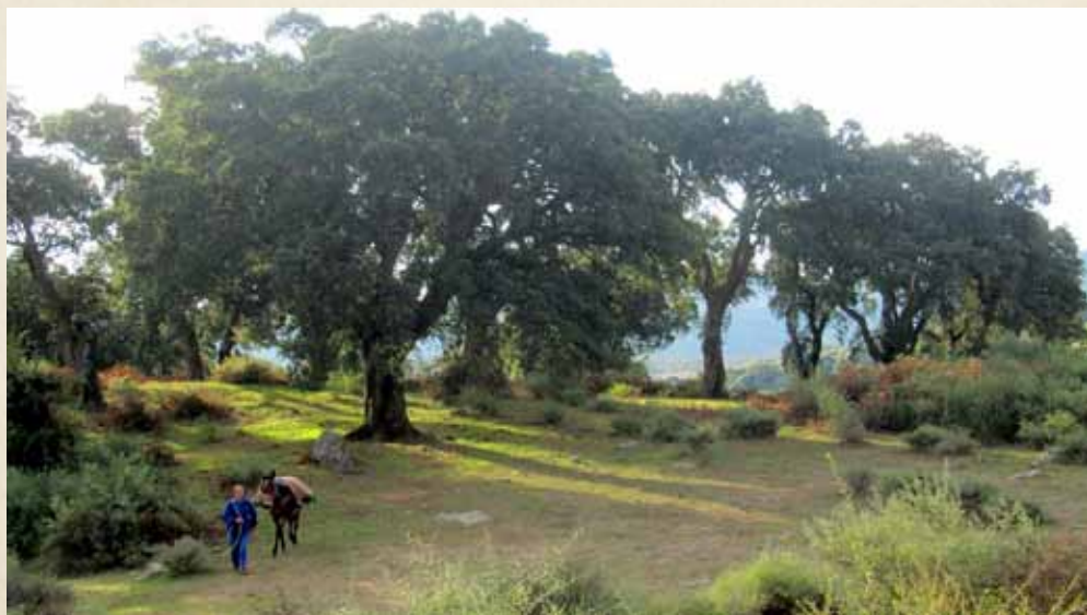
RELLANO JUNTO A LOS TRES PINOS, EN LA FALDA DEL CERRO DEL RAYO.