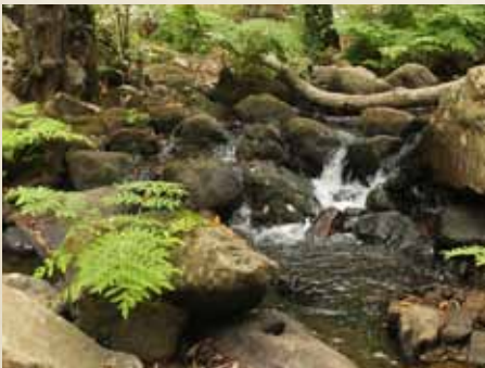
HELECHOS REALES EN LA RIBERA DEL RÍO.

Se trata de un maravilloso rincón natural de Algeciras, donde su paseo romántico nos hará perder la noción del tiempo y apreciar la sencillez y belleza de nuestros paisajes.