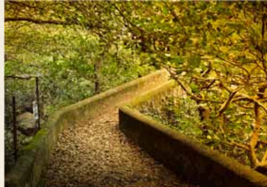
PUENTE DEL SIGLO XVIII, DE TRAZA MEDIEVAL.

Auque el río de la Miel también es conocido por el río de las Pozas, al final del sendero autorizado encontraremos esta primera poza espectacular, con una gran chorrera que hará las delicias para todos aquellos que quieran disfrutar de un refrescante baño.