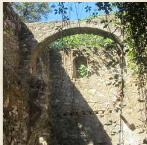
MOLINO DEL ÁGUILA

El molino del Águila, en completa ruina, se trata de un curiosísimo molino hidráulico pues recibía el agua de la acequia a través de una terraza superior, donde el agua penetraba a su interior en caída libre.