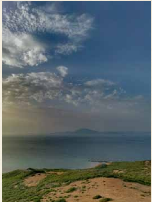
EL ESTRECHO VISTO DESDE EL BÚNKER.

En estos altos resuenan los ecos de Hércules, pero también los de Gary Cooper, que nos recuerdan que el mundo es ancho y diverso, cercano y lejano. Los tambores han redoblado bien cerca, a nuestra misma vera, en lugares también cercanos pero no muy conocidos; quizás por eso mismo, no hemos sido capaces de oírlos, ni siquiera de apreciarlos, aunque nunca es tarde para hacerlo.