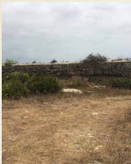
BÚNKER DEL CERRO DEL TAMBOR.

Dos vertientes, dos continentes, dos mares, dos columnas. Nos adentramos en un lugar mítico, en el límite del mundo conocido para los griegos, en el décimo trabajo de Hércules, en la frontera de la cuenca mediterránea.