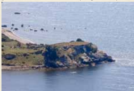
PLATAFORMA SOBRE LA QUE ESTUVO INSTALADO EL FUERTE DE TOLMO.

En el búnker existe hoy un mirador impresionante hacia el Estrecho, desde donde las panorámicas son extraordinarias: a nuestra izquierda, la punta del Acebuche , la ensenada del Tolmo y cala Arenillas con sus plataformas de abrasión; frente a nosotros, la unión del Mediterráneo con el Atlántico, la cordillera del Rif con el Djebel Musa , el islote de Perejil y más a la izquierda Ceuta y su monte Hacho ; y debajo de nosotros, la punta de la Parra . También veremos varias plataformas de abrasión y algunos flysch .