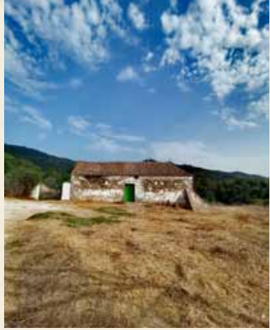
CORTIJO-HUERTA DE LOS PALOS.

Con estos antecedentes, no resulta raro que se edificara el complejo de la Huerta Grande , una serie de villas al sur de la garganta de Marchenilla que fueron un referente para el Gobierno Militar del Campo de Gibraltar. Allí se erigió la casa donde acabó veraneando el general, junto a la que se alzaba la vivienda del comandante Jefe de Estado Mayor. Allí huyeron numerosos ciudadanos cuando el bombardeo del Jaime en agosto de 1936. Allí, entre robles y alisos, ocultos pero