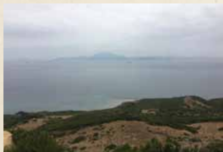
OTRA VISTA DEL ESTRECHO, ÁFRICA AL FONDO.

Dos vertientes, dos continentes, dos mares, dos columnas. Nos adentramos en un lugar mítico, en el límite del mundo conocido para los griegos, en el décimo trabajo de Hércules, en la frontera de la cuenca mediterránea.