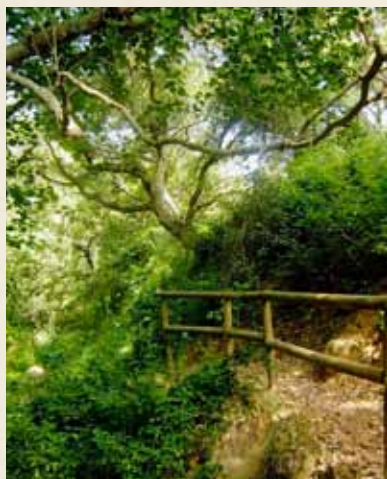
GARGANTA O CANUTO DEL 'ARROYO MARCHENILLA'.

POR JOSÉ JUAN YBORRA AZNAR (PROFESOR DE LA UNED)