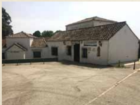
CENTRO DE VISITANTES 'HUERTA GRANDE', DONDE DESAYUNAREMOS Y ALMORZAREMOS.

Aquí la historia con mayúsculas ha campado por unos espacios que son ejemplo de una marcada diversidad paisajística. A pesar de su cercanía, encierra perspectivas que merecen la pena ser exploradas.