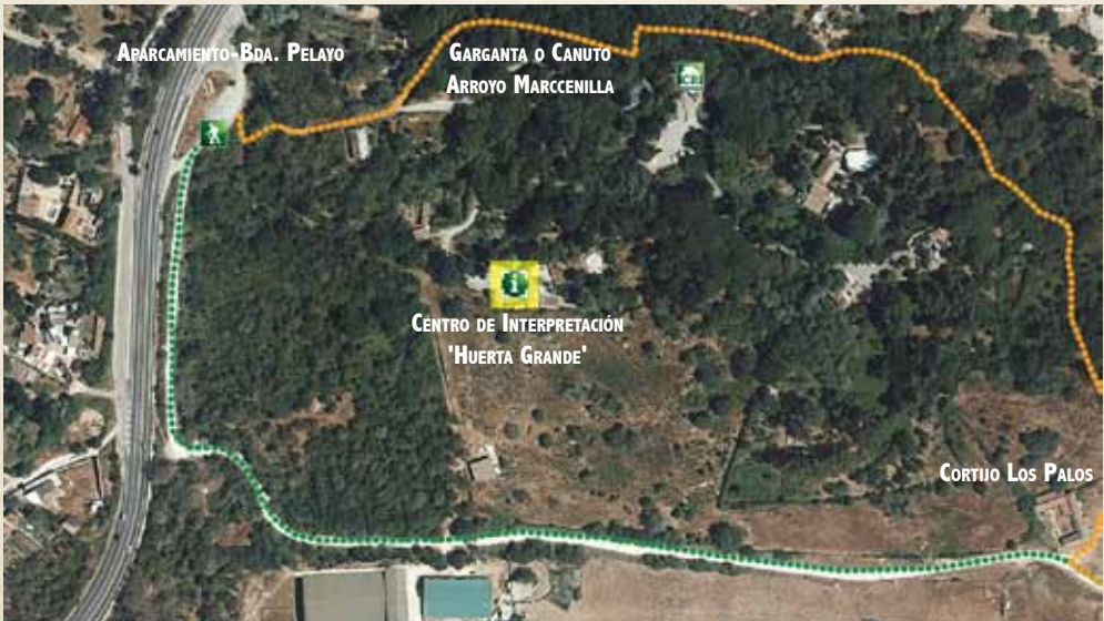
GARGANTA DEL ARROYO MARCHENILA, DE COLOR NARANJA.

cercanos, convivieron militares españoles y espías italianos en los convulsos y novelescos años de la Segunda Guerra Mundial. Allí resonaron los ecos de Canaris y de otros jefes de los servicios de información mundiales y allí acabó cumpliendo prisión Jaime Miláns del Bosch a principios de los ochenta, entre ordenanzas uniformados que le servían el menú de restaurantes cercanos.