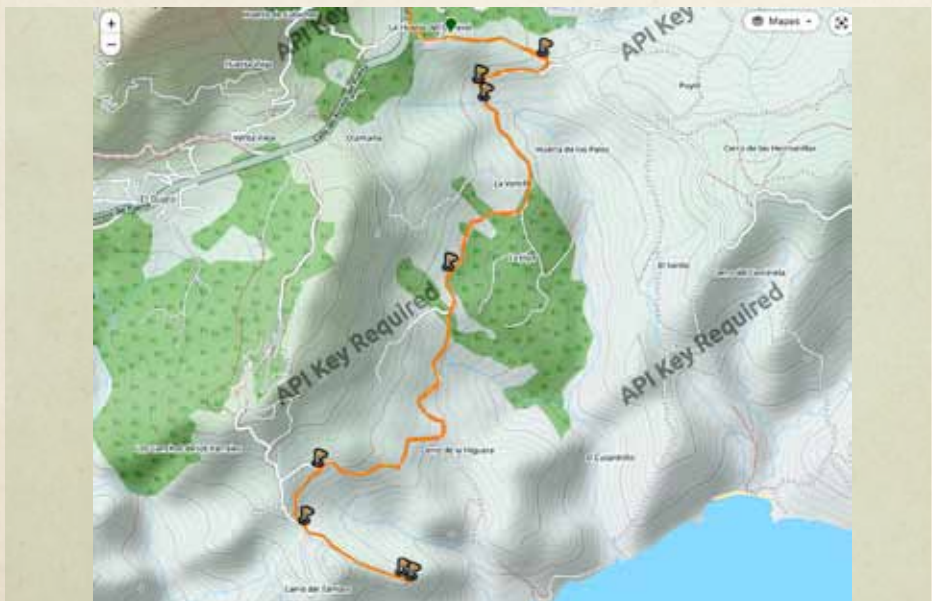
RUTA DESDE EL CENTRO DE INTERPRETACIÓN 'HUERTA GRANDE' AL 'CERRO DEL TAMBOR'.