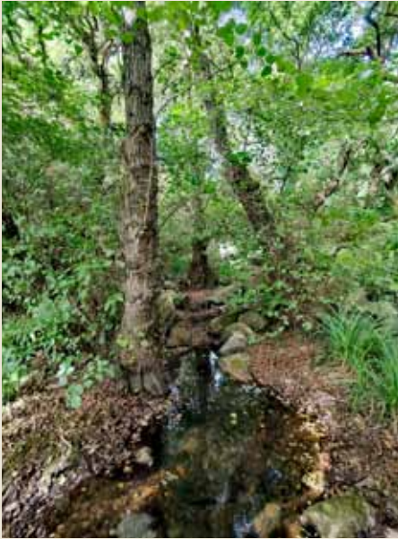
GARGANTA O CANUTO DE MARCHENILLA.

POR JOSÉ JUAN YBORRA AZNAR (PROFESOR DE LA UNED)