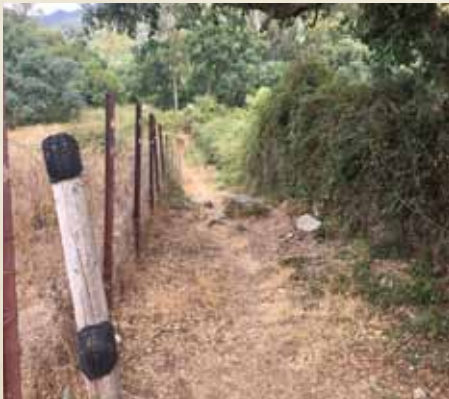
CAMINO QUE CONECTA LA GARGANTA MARCHENILLA CON EL CORTIJO LOS PALOS.

Se suceden curvas y hangarillas, cerros y cercados, antiguos cortijos hoy redescubiertos y un sonoro conjunto de molinos que se sirven de los vientos.